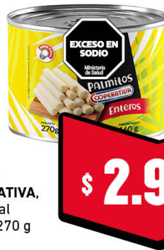
Palmitos COOPERATIVA, enteros, al natural, 270 g

Disponibles (u.): 4.300 El kg $ 2.966,67 PRECIO SIN IMPUESTOS NACIONALES: $ 735,54