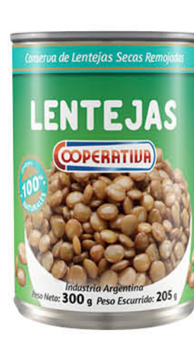
Lentejas COOPERATIVA, remojadas, 300 g

Disponibles (u.): 24.700 El kg $ 1.966,67 PRECIO SIN IMPUESTOS NACIONALES: $ 487,60