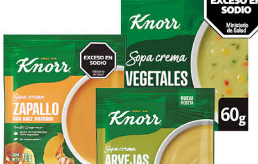
Sopa crema KNORR, varios sabores, 60, 64 o 70 g

Disponibles (u.): 30.000 El kg $ 22.368,42 PRECIO SIN IMPUESTOS NACIONALES: $ 1.053,72