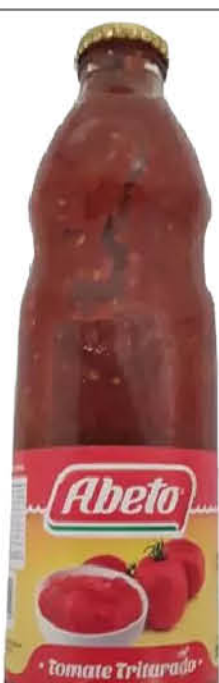
Tomate triturado ABETO, 950 g

Disponibles (u.): 12.900 El kg $ 1.510,00 PRECIO SIN IMPUESTOS NACIONALES: $ 623,97