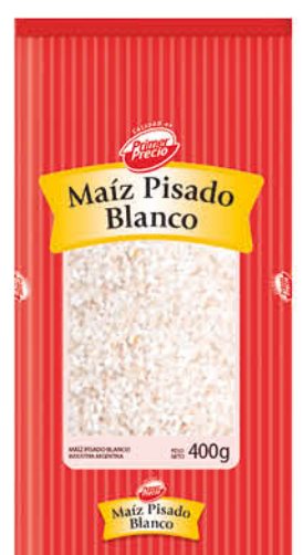
Maíz pisado PRIMER PRECIO, blanco, 400 g

Disponibles (u.): 12.600 El kg $ 4.062,50 PRECIO SIN IMPUESTOS NACIONALES: $ 1.470,59