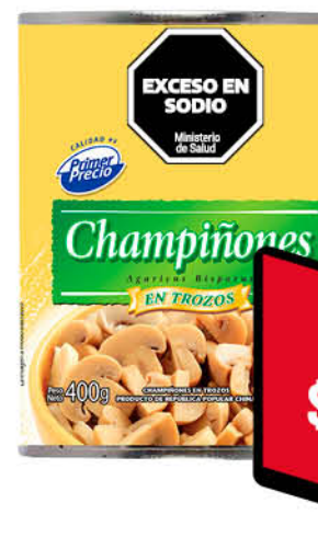
Champiñones PRIMER PRECIO, en trozos, 400 g

Disponibles (u.): 6.100 El kg $ 11.074,07 PRECIO SIN IMPUESTOS NACIONALES: $ 2.471,07