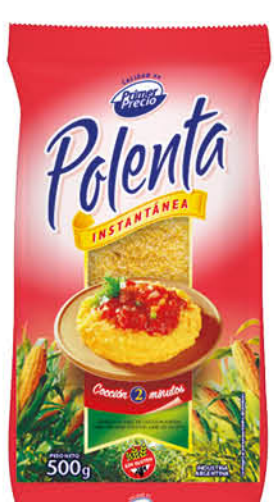
Polenta PRIMER PRECIO, Instantánea, 500 g

Disponibles (u.): 9.900 PRECIO SIN IMPUESTOS NACIONALES: $ 1.470,59