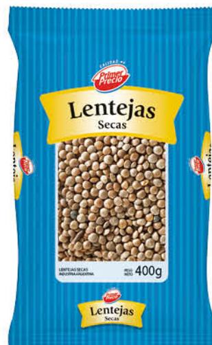
Lentejas PRIMER PRECIO, secas, 400 g

Disponibles (u.): 1.400 El kg $ 3.672,50 PRECIO SIN IMPUESTOS NACIONALES: $ 1.329,41