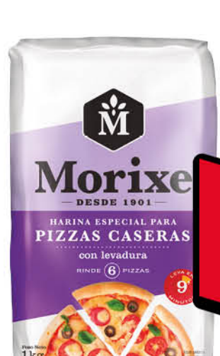
Harina de trigo MORIXE, Especial pizzas caseras, con levadura, 1 kg

Disponibles (u.): 7.500 PRECIO SIN IMPUESTOS NACIONALES: $ 1.175,57