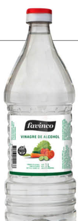
Vinagre de alcohol FAVINCO, 1 L

Disponibles (u.): 12.000 El kg $ 2.472,63 PRECIO SIN IMPUESTOS NACIONALES: $ 1.941,32