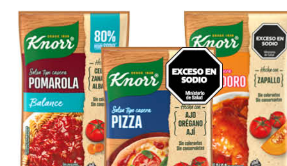
Salsa lista KNORR, varios sabores, 340 g

Disponibles (u.): 11.000 60 g - El kg $ 32.916,67 70 g - El kg $ 28.214,29 PRECIO SIN IMPUESTOS NACIONALES: $ 1.632,23