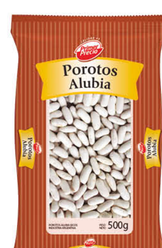
Porotos PRIMER PRECIO, Alubia, 500 g

Disponibles (u.): 3.400 El kg $ 4.612,50 PRECIO SIN IMPUESTOS NACIONALES: $ 1.469,68