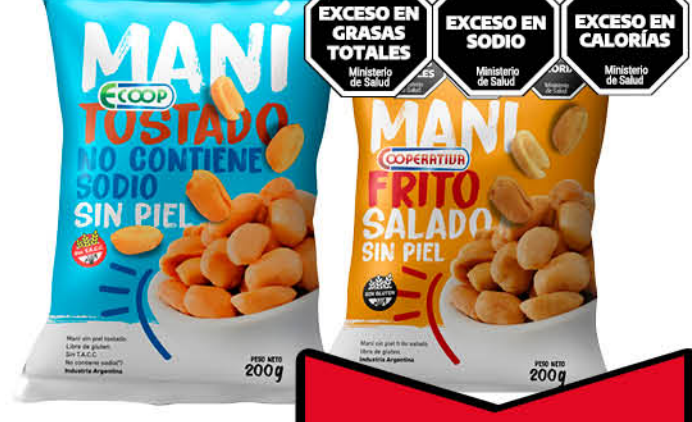
Maní tostado ECOOP, sin piel, sin sodio agregado o COOPERATIVA, frito, salado, sin piel, 200 g