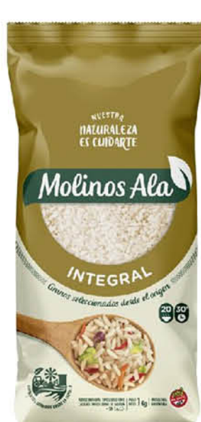
Arroz Integral MOLINOS ALA, Integral, 1 kg

Disponibles (u.): 21.900 PRECIO SIN IMPUESTOS NACIONALES: $ 990,91