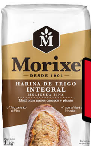
Harina de trigo MORIXE, Integral, Molienda fina, 1 kg

Disponibles (u.): 34.500 PRECIO SIN IMPUESTOS NACIONALES: $ 768,33