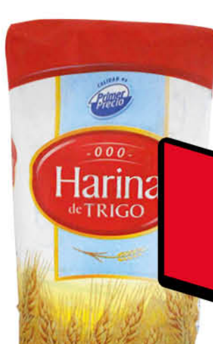
Harina de trigo PRIMER PRECIO, 000, 1 kg

Disponibles (u.): 3.200 PRECIO SIN IMPUESTOS NACIONALES: $ 1.528,10