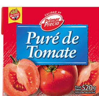
Puré de tomate PRIMER PRECIO, 520 g

Disponibles (u.): 7.600 PRECIO SIN IMPUESTOS NACIONALES: $ 1.123,14