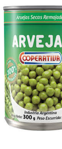
Arvejas COOPERATIVA, al natural, 300 g

Disponibles (u.): 2.300 El kg $ 5.018,00 PRECIO SIN IMPUESTOS NACIONALES: $ 2.270,59