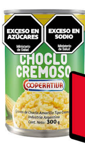
Choclo amarillo COOPERATIVA, cremoso, 300 g

Disponibles (u.): 3.600 El kg $ 3.966,67 PRECIO SIN IMPUESTOS NACIONALES: $ 983,47