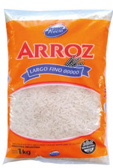
Arroz PRIMER PRECIO, Largo fino 00000, 1 kg