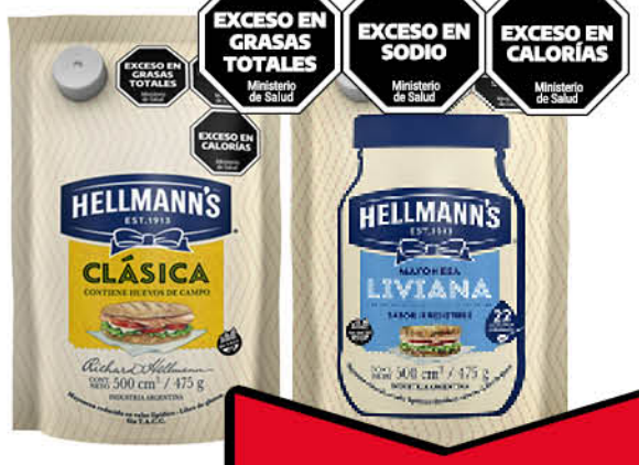
Mayonesa HELLMANN'S, Clásica o Liviana, doy pack, 475 g

Disponibles (u.): 5.000 El kg $ 10.845,00 PRECIO SIN IMPUESTOS NACIONALES: $ 1.792,56