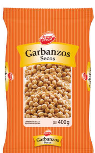
Garbanzos PRIMER PRECIO, secos, 400 g

Disponibles (u.): 77.800 El kg $ 1.651,92 PRECIO SIN IMPUESTOS NACIONALES: $ 709,92