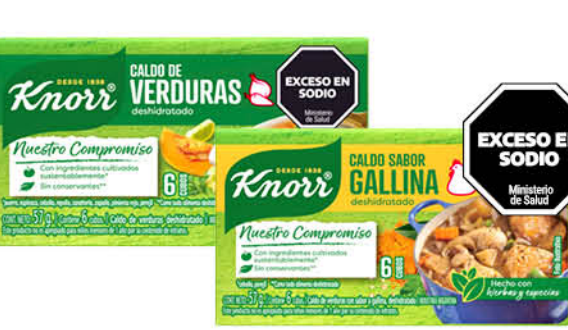
Caldo en cubos KNORR, Verduras o Gallina, 6 u, 57 g

Disponibles (u.): 5.400 El kg $ 6.975,00 PRECIO SIN IMPUESTOS NACIONALES: $ 2.305,79